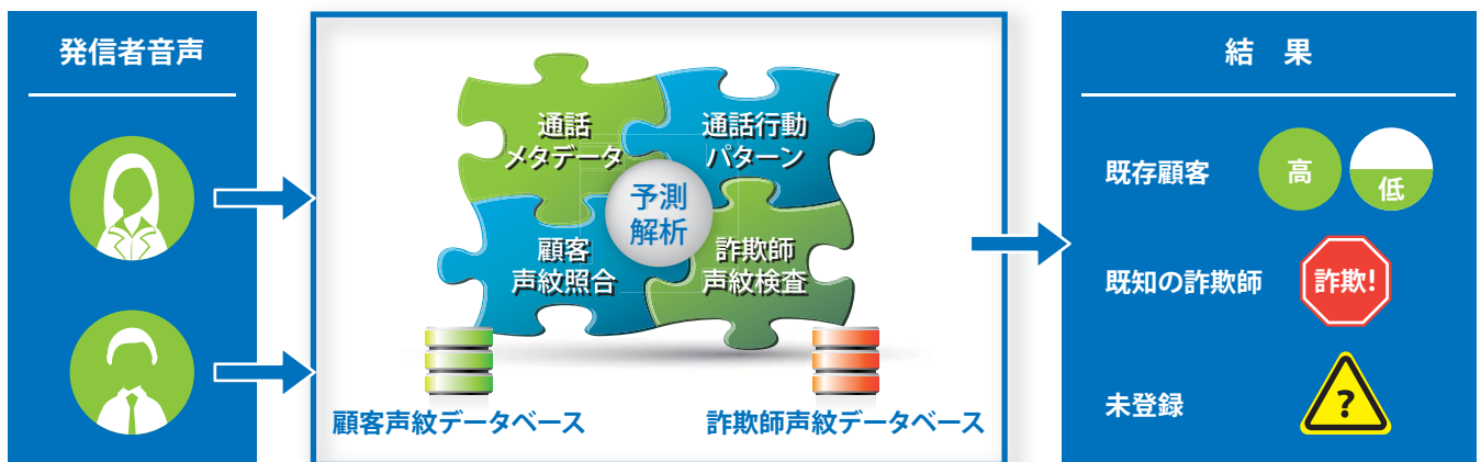
声紋分析ソリューション概要

Verint 本人認証ソリューションは、ワークフォース最適化ソリューションと組み合わせて利用することができます。映像分析、顔認識、会話音声とデータ分析、デスクトッププロセス分析を含む、企業の不正とリスク分析製品群の一部のソリューションです。盗難に対する素早い対処や、規定に違反していたりベストプラクティスに外れている言動を検知し即座に対応できるよう、リスクと不正を最小限に抑え、不正による損失を防ぎます。