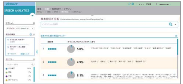
相関性の高い語句により通話群を同一内容に自動的にグループ化

の通話群にまでグループ化され、顧客の架電理由を即座に把握することが可能になります。