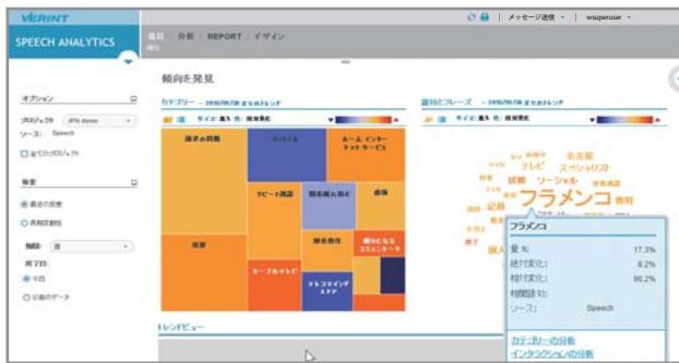
週間から年間まで、様々な期間範囲で急増減した語句を自動的に発見し、顧客の傾向を把握

Verint 会話音声分析は、期間内に最も出現頻度が変化した語句を全通話から自動的に発見します。トレンド分析では、語句指定が一切不要であり、予想外の急増減語句の発生を把握でき、また、予めキーワードを設定しておいて、それを含む通話の増減を把握することもできます。この傾向の発見と証明により、問題に対して先見性をもった対策を実施することが可能になります。