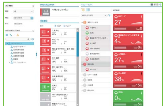
個人/チーム全体のパフォーマンスを効果的に確認・管理・改善するためのフレームワークを提供

Verint パフォーマンス管理は、個人、チーム、および組織のパフォーマンスを簡単に分析することができ、効率的に追跡管理が可能、パフォーマンス改善の機会やKPIを特定することができる直感的なインターフェースを提供します。複数のシステム間でデータをキャプチャし、集計することも可能です。スコアカード、コーチング、eラーニング機能を相乗的に活用でき、ビジネス全体を通して顧客体験に影響を与えるプロセスとパフォーマンスの管理を支援します。