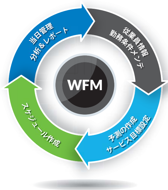
Verint ワークフォースマネジメントの機能フロー

Verint® ワークフォースマネジメントは、コンタクトセンターだけでなく支店や事務管理業務に至るまで、企業全体にわたって業務の計画、予測を行い、あらゆる種類の業務で目標とするサービスレベルを引き出すために、それに適したスタッフの能力や勤務条件を考慮した最適なスケジューリングの実現が可能です。更に日々の計画からの乖離に対する再スケジュールや調整を行うことも可能です。