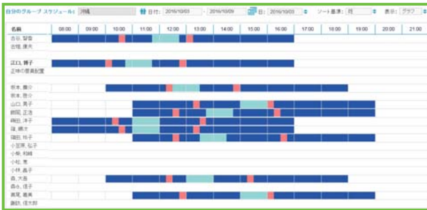
勤務スケジュールをウェブベースのポータルで表示

ポータルでは個別のホームページを介して指示されたeラーニングやコーチングの資料にアクセスできるだけでなく、現状および今後のスケジュール、スコアカード、スケジュールの順守などを表示する従業員の個人管理機能を提供します。休暇申請やシフト交換、シフト入札を自動化することで、ポータルは管理者による監督時間を短縮するための支援をします。