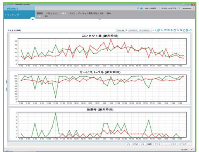
予測と実際の情報をリアルタイムに表示

実際の呼量、AHT、ASA（平均応答時間）、サービスレベル、要員の数などをリアルタイムに確認することができます。また、予測からの乖離を瞬時に把握することができるため、スケジュールの再調整を実行し、当日の業務に対して迅速に対応できます。