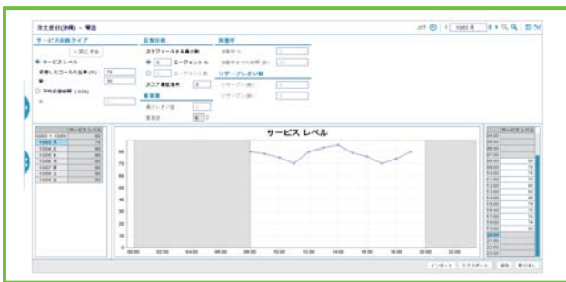
サービス目標に基づいたシミュレーション

最適な業務計画を立てるためには、明確なサービス目標の設定が必要になります。Verint ワークフォースマネジメントはメール、チャット、さらにはバックオフィス業務まで、それぞれの作業に応じたサービス目標を容易に設定することができます。また、サービスレベルに影響を与えるエージェントの熟練度を考慮した設定も可能です。これにより、余剰人員を抑えつつ、高いサービスレベルを確保します。