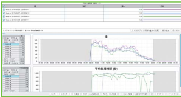
過去の実績を元にしたコール量、AHTの予測

過去のコンタクト履歴や実績をもとに、業務量やAHT（平均処理時間）などを必要な業務ごとに予測を作成することができます。また、作業ごとのタイムラグやシステム障害など、予測に影響を与える要因にも配慮して最適なスケジュールを業務ごと作成することが可能です。